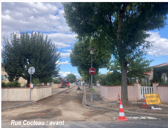
Rue Cocteau : avant

D'ici la fin de l'année, les trottoirs de la rue Jean Cocteau seront également refaits, une traversée piétonne sera créée route de Graulhet pour accéder en sécurité à l'arrêt de bus « Taillades », et un ralentissement sera réalisé au niveau de l'entrée du citystade et du pumptrack.