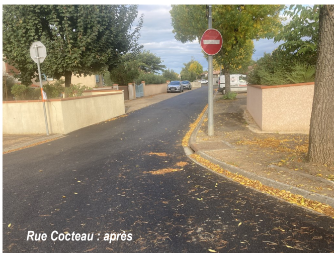
Rue Cocteau : après