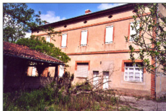
Vue côté jardin

Située en bordure immédiate de la RN 88, en face de l'Église Fonlabour, cette ancienne Mairie—Ecole du Séquestre était un bâtiment singulier qu'on remarquait à peine tellement il « faisait partie du paysage ».