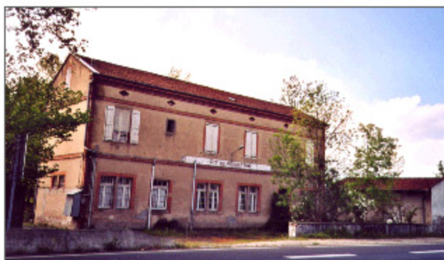
Façade des bâtiments vue de la RN 88